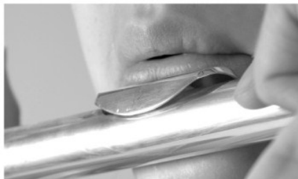
Low Note Embouchure