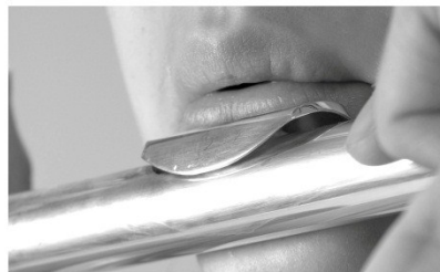
Lipstand voor de lage noten: