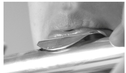
Lipstand voor de hoge noten:

Beweeg de lippen naar voren en maak je opening kleiner bij de hoge noten.